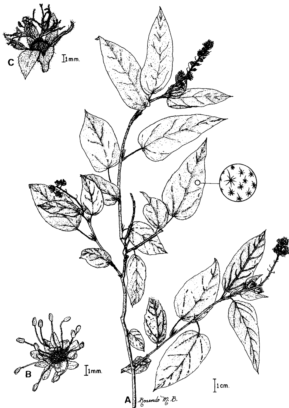
Fig. 2. Croton acapulcensis (Basado en N. Noriega Acosta 599). A. Aspecto general de una rama, B. Flor estaminada, C. Flor pistilada.